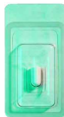
Кат. № 0102 Превръзка CollaPlug 3/8"x3/4"

Удобната кутия позволява да хванете превръзките за рани Zimmer Dental с пръстите си по време на процедурите.