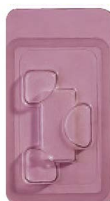
Кат. № 0101 Превръзка CollaCote 3/4" x 1 1/2"