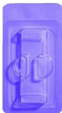
Кат. № 0100 Превръзка CollaTare 1"x3"

Резорбируемите колагенови превръзки за рани се доставят стерилни, в индивидуални блистерни опаковки в следните конфигурации: